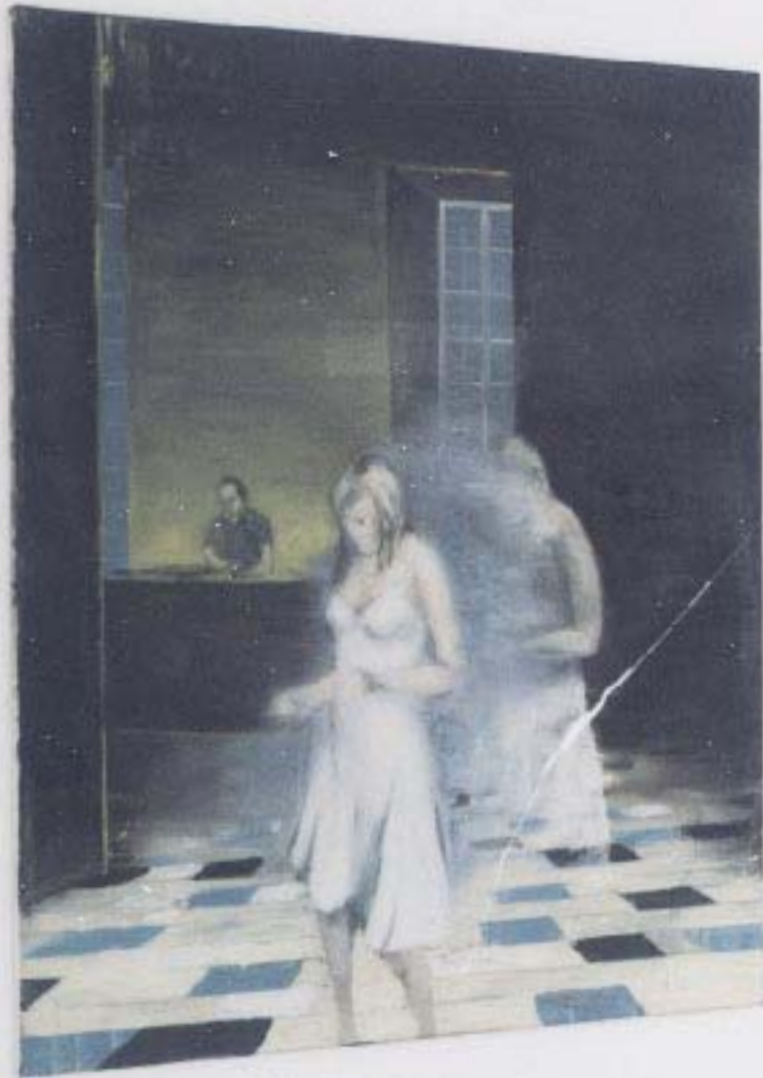
»Dopplereffekt« Öl auf Leinwand